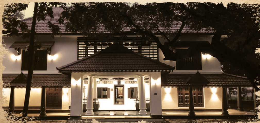
Thrissur Thaikat Mana

When Sakthan Thampuran came to know about their turn of fate, he rehabilitated Pazhanellippurathu Mooss family at Kizhakkumpattukara, Thrissur. Henceforth, the family came to be famously known as Thrissur Thaikat Mooss.