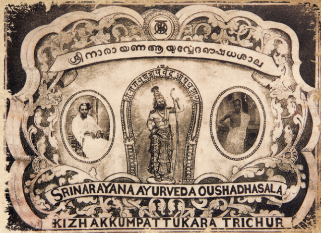
SNA Old Logo

A giant dive in the field of Ayurveda for the family happened during the period of the